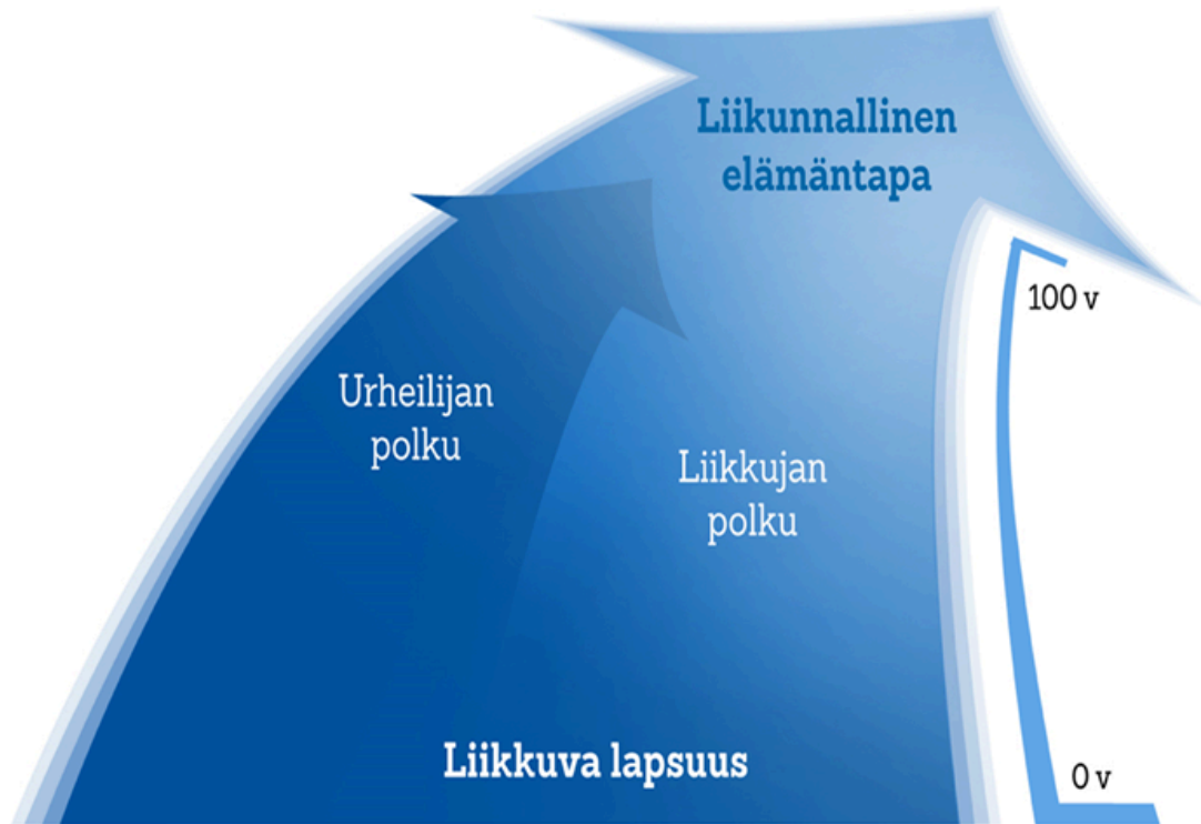
Kuva 1. Tanssijan polku liikkuvasta lapsuudesta liikunnalliseen elämäntapaan.